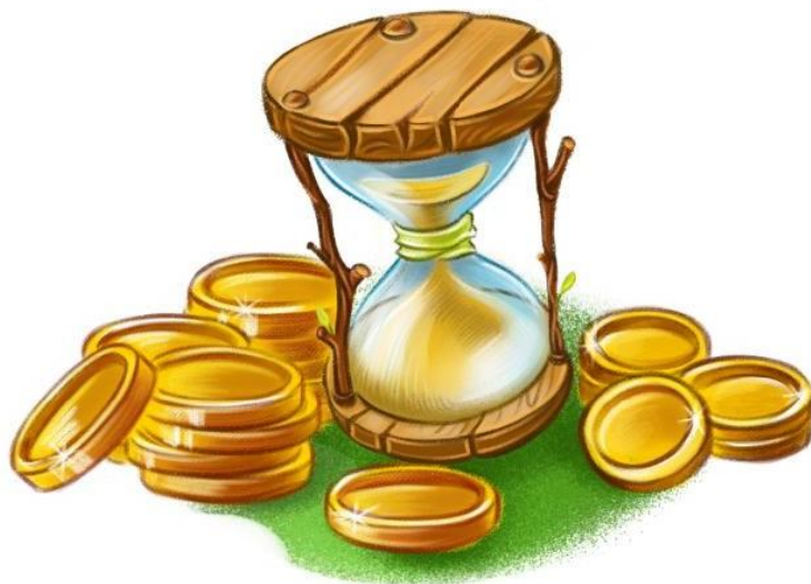
ПРИ ВЫБОРЕ ДЕПОЗИТА