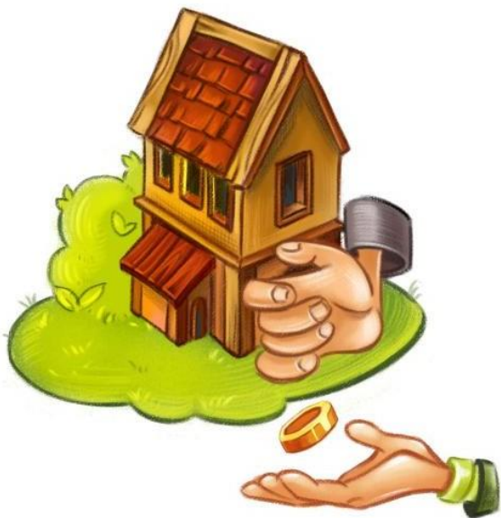
ПРИ ПРИВЛЕЧЕНИИ КРЕДИТА (ИПОТЕКИ)

При принятии финансовых решений и личном финансовом планировании