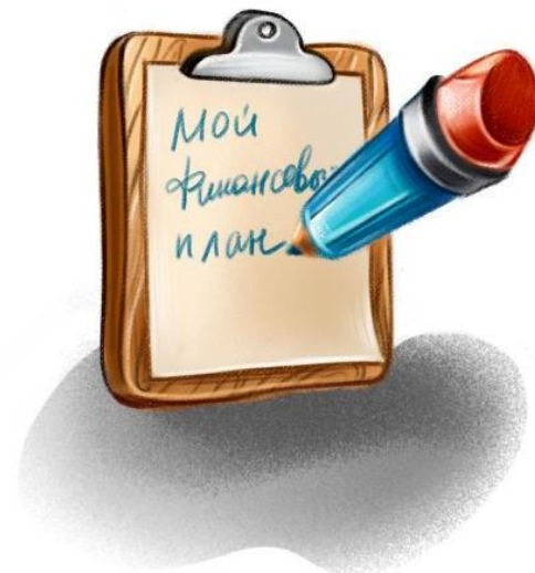
ПРИ СОСТАВЛЕНИИ ЛИЧНОГО ФИНАНСОВОГО ПЛАНА